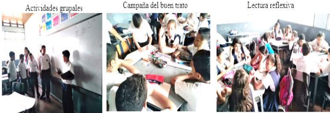
Foto tomada por las autoras sobre las actividades para fortalecer lazos afectivos

Como último aspecto, la escucha activa, se tuvo en cuenta de igual manera las posibles causas encontradas durante la investigación que dieron paso a hallar los problemas tales como: todos querían hablar a la vez, ruido, intervenciones inapropiadas en las clases, falta de atención, distracción, poco respeto hacia el compañero entre otros, estas problemáticas accedieron a planear y aplicar diferentes actividades y estrategias que permitieron fomentar la escucha activa para mejorar los procesos comunicativos, ambientes de aprendizaje y una sana convivencia escolar. Tales como: Acuerdos para la escucha activa, dinámicas (alcanza la estrella) videos reflexivos (nunca digas no puedo) exposiciones, juegos (el teléfono roto), conversatorios entre otros.