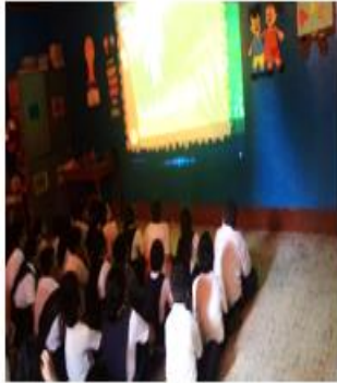
Taller de resolución de conflicto