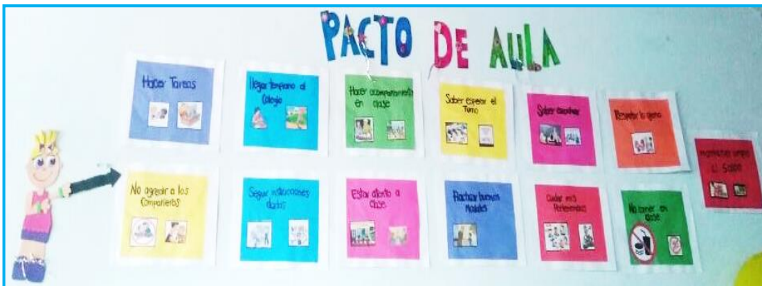
Foto tomada por las autoras sobre los acuerdos establecidos por los estudiantes