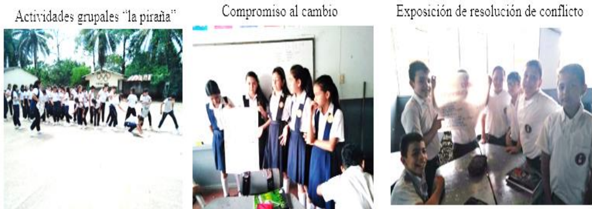
Foto tomada por las autoras para fortalecer y mediar conflictos

Fotos N° 10 Actividades Ausencia de Valores y faltade estrategias para la solución de conflictos