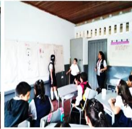
Foto tomada por las autoras para disminuir la violencia física y verbal